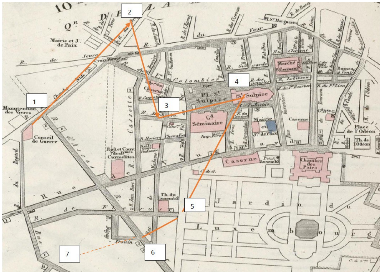
Petit Atlas Pittoresque de Paris (1835), Le Quartier du Luxembourg